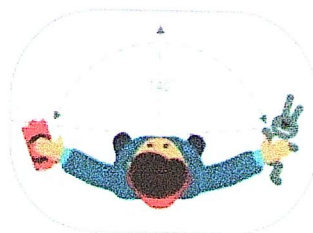
НОРМАЛЬНОЕ БОКОВОЕ ЗРЕНИЕ

Если ребенок не видит игрушки по бокам и не может определить их цвет – это признаки туннельного зрения. Рекомендуется обращение к офтальмологу и неврологу.